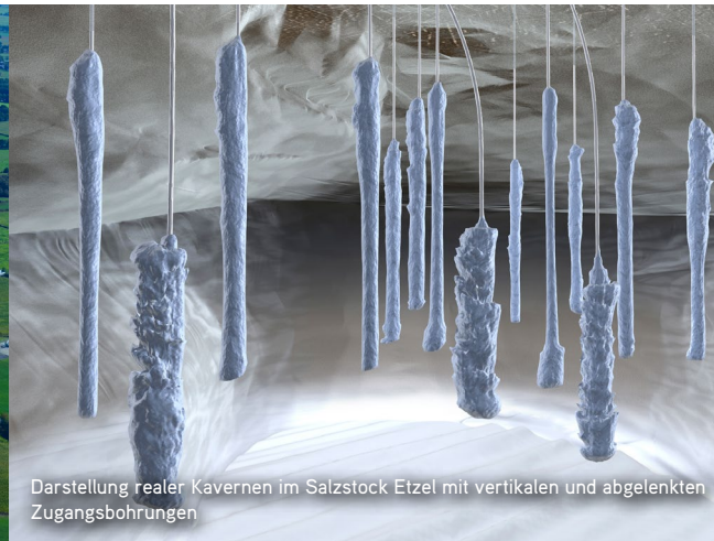
Darstellung realer Kavernen im Salzstock Etzel mit vertikalen und abgelenkten Zugangsbohrungen