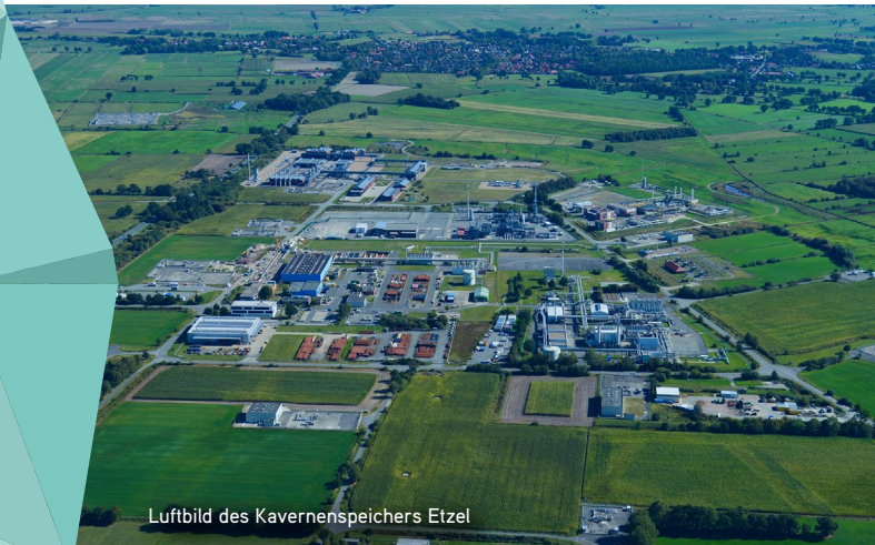
Luftbild des Kavernenspeichers Etzel