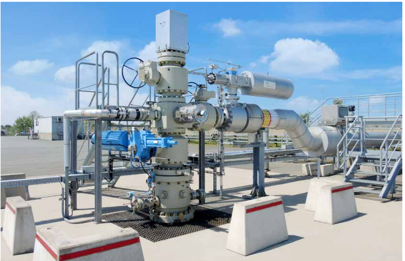
Auf dem neuesten Stand: Gaskavernenköpfe in Etzel

Bereits 1973 hatte sich die Richtigkeit der Entscheidung für eine strategische Ölreserve bestätigt. Als es infolge der Erhöhung der Rohölpreise zur ersten Ölkrise kam, kam es im Zusammenhang hiermit auch zur wirtschaftlichen