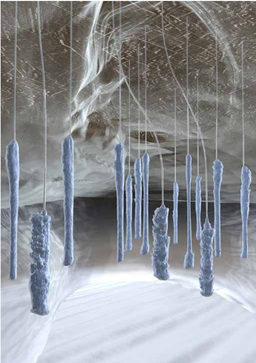
Unser Potential liegt im Untergrund: Darstellung realer Kavernen im Salzstock Etzel mit vertikalen und abgelenkten Zugangsbohrungen